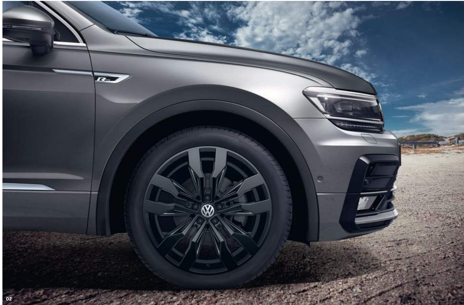
02 Sportiviteit met uitstraling. Met de 20-inch lichtmetalen velgen 'Suzuka' in Dark Graphite met glanzend oppervlak is de Tiguan koning op de weg. MU