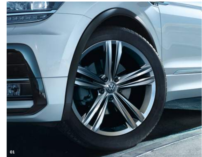
01 Maak indruk op het asfalt met de 19 inch 'Sebring' lichtmetalen velgen met een 5-dubbelspaaks design in grijs metallic. MU

Sport zit in zijn genen. En als Sport Utility Vehicle is het de missie van de Tiguan om zijn ambities waar te maken. Het R-Line pakket geeft hem de sportieve uitstraling die daarbij past, met zowel binnen als buiten geweldige details. Gaat het jou vooral om de dynamische uitstraling? Kies dan voor het pakket R-Line Exterior.