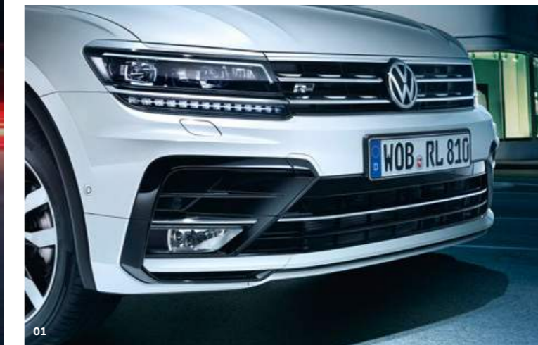
01 De chromen lamellen in de grille en de dynamische lijnen op de motorkap lopen stijlvol over in de LED-koplampen. MU

Het robuuste design van de Tiguan verklapt direct waar hij toe in staat is. Wil je echt overal uit de voeten kunnen? Kies dan voor een vierwielaangedreven uitvoering met 4MOTION Active Control. Hierbij heb je de keuze uit verschillende rijstijlopties, zoals Snow, Onroad en diverse off-road-instellingen. Ultieme vrijheid.