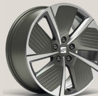
Performance Aero FR P8R

Reference R Style (Business Intense) St FR (Business Intense, PHEV) FR