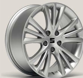
Dynamic St PUA