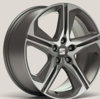
Performance 2 FR PUN