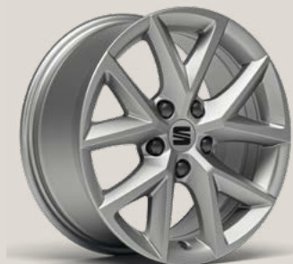
Urban R St