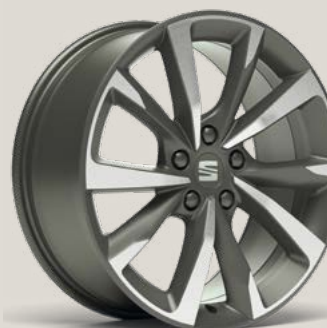
Performance FR PUK