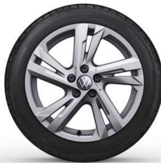
16" Lichtmetalen velg 'Valencia'