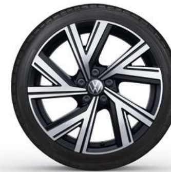
17" Lichtmetalen velg 'Bergamo'