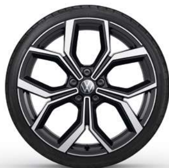
18" Lichtmetalen velg 'Faro'