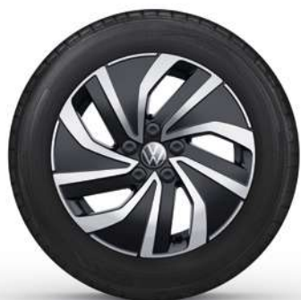
15" Lichtmetalen velg 'Essex'

Optioneel op de Polo en standaard op de Polo Life