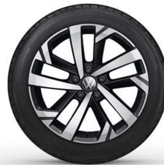
16" Lichtmetalen velg 'Torsby'