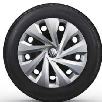
15" Stalen velg 'Tortosa'

Optioneel op de Polo en standaard op de Polo Life