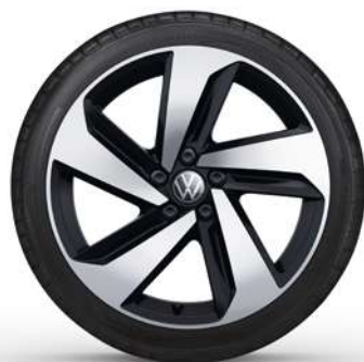
17" Lichtmetalen velg 'Milton Keynes'