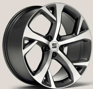
Cosmo Grey FR FPB