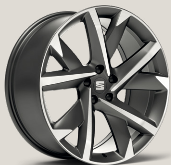
Supreme Cosmo Grey FR FPB

Style Business Intense St FR Business Intense FR FR PHEV Business FPB