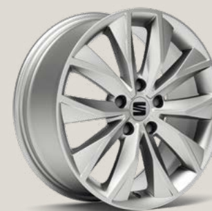
Dynamic Brilliant Silver SBI