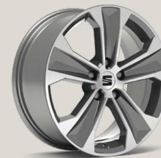
Dynamic Nuclear Grey SBI PUA