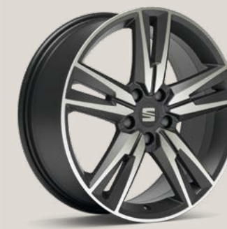
Performance Cosmo Grey FBI PUK