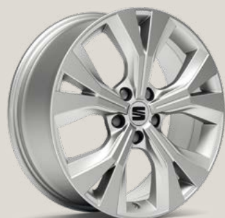
Performance Brilliant Silver type 1 XBI