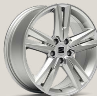
Performance Brilliant Silver type 2 FBI