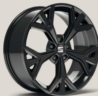
Exclusive Glossy Black