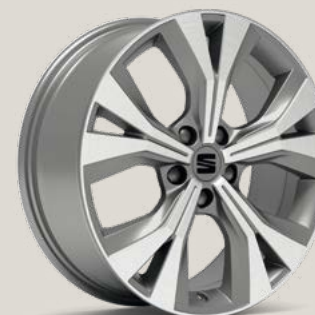
Performance Nuclear Grey SBI XBI PUP