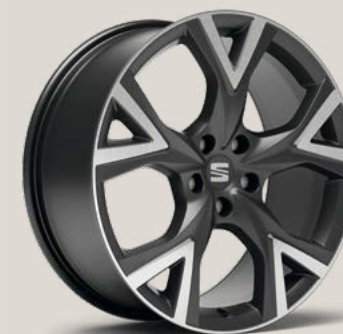
Exclusive Cosmo Grey Type 2