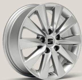
Design Brilliant Silver R