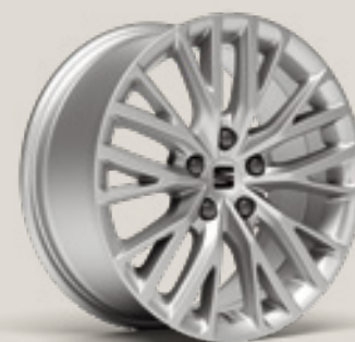
Performance St PUB