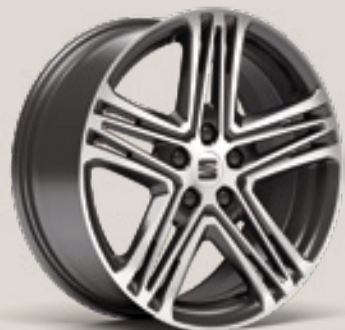
Performance FBI FPH PUM