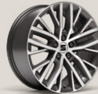
Performance FBI PUP