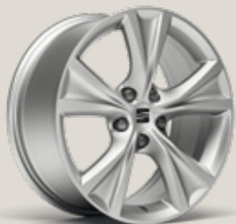
Dynamic FR FBI FPH