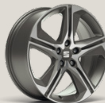
Performance 2 FBI FPH PUN