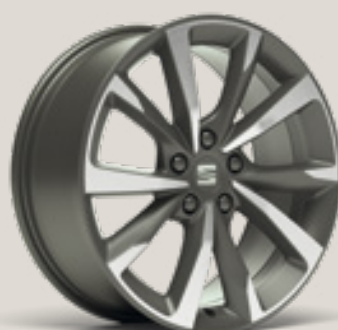
Performance FBI FPH PUK