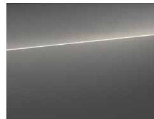
Typhoon grijs metallic